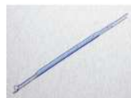
öse ( www.humeau.com )