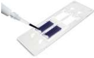
Lame de comptage Neubauer ( https://www.ugap.fr )