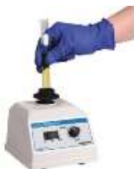
Agitateur vortex ( www.fishersci.fr )