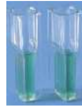
Semi micro-cuve ( www.fr.vwr.com )

Cette année encore, les élèves ont été pour la plupart très calmes et très posés (parfois trop calmes et pas assez investis). Nombreux sont ceux qui ont mal géré leur temps malgré une mise en garde en début de sujet : mauvaise prise en charge des temps d'attente liés aux manipulations, attitude trop passive. Cette épreuve exige de savoir doser calme et efficacité.