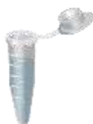
Microtube ( https://commons.wikimedia.org )

Afin d'aider les futurs candidats, voici quelques photos permettant de connaître certains matériels de laboratoire qui posent problème à certain.e.s. Il est rappelé que les candidat.e.s ne sont pas pénalisés s'ils.elles posent des questions et qu'ils.elles sont explicitement invité.e.s à le faire pour toutes questions concernant du matériel.