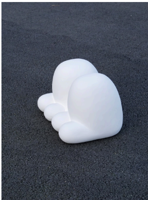
Étapes de production de la sculpture Jump