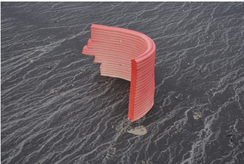
Étapes de production de la sculpture Left-over