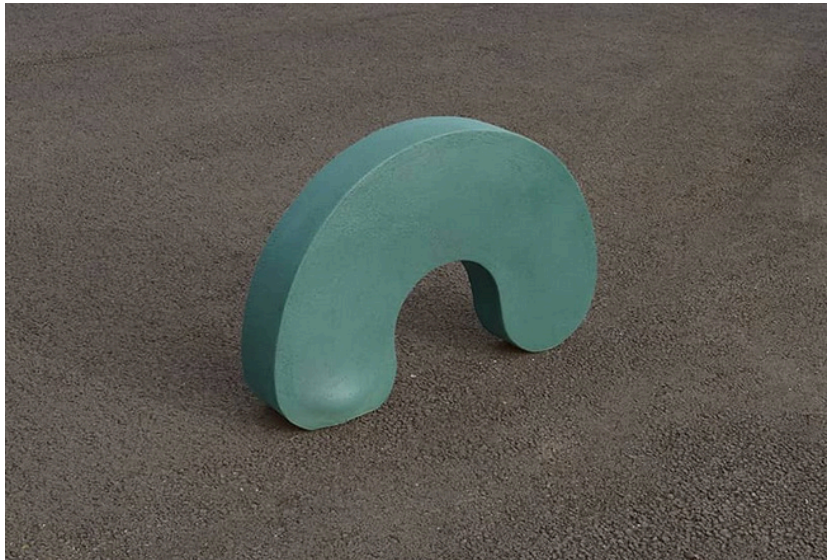
Étapes de production de la sculpture Expansion