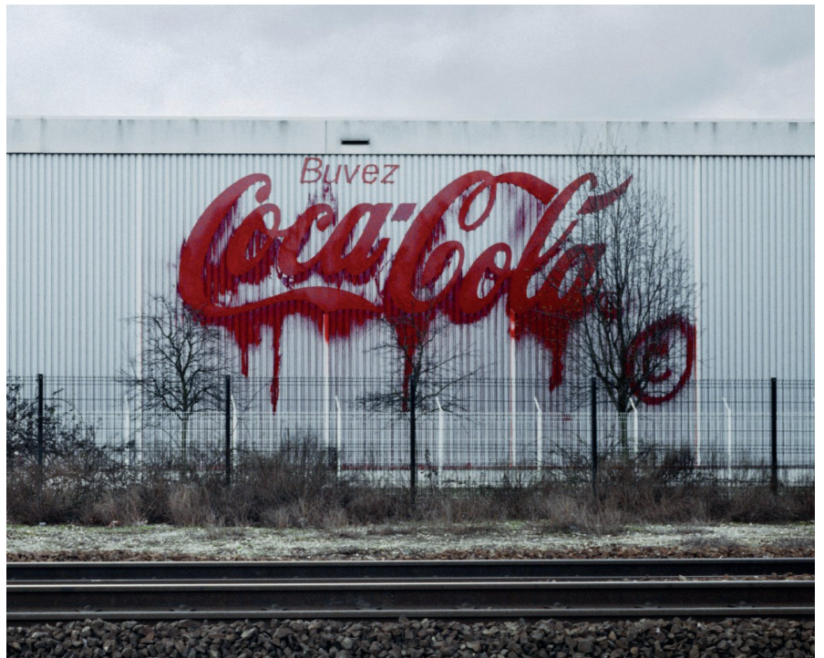
ZEVS (dit Zeus, street-artist français), Liquidated Logos , depuis 2006. - Peinture, technique du dripping.