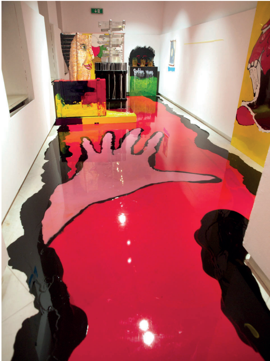
Gaetano Pesce , exposition Altra bellezza (Other beauty) , Milan, Palazzo Morando, 2016. - Gaetano Pesce à l'œuvre avec la résine. - Sol en résine par Gaetano Pesce.