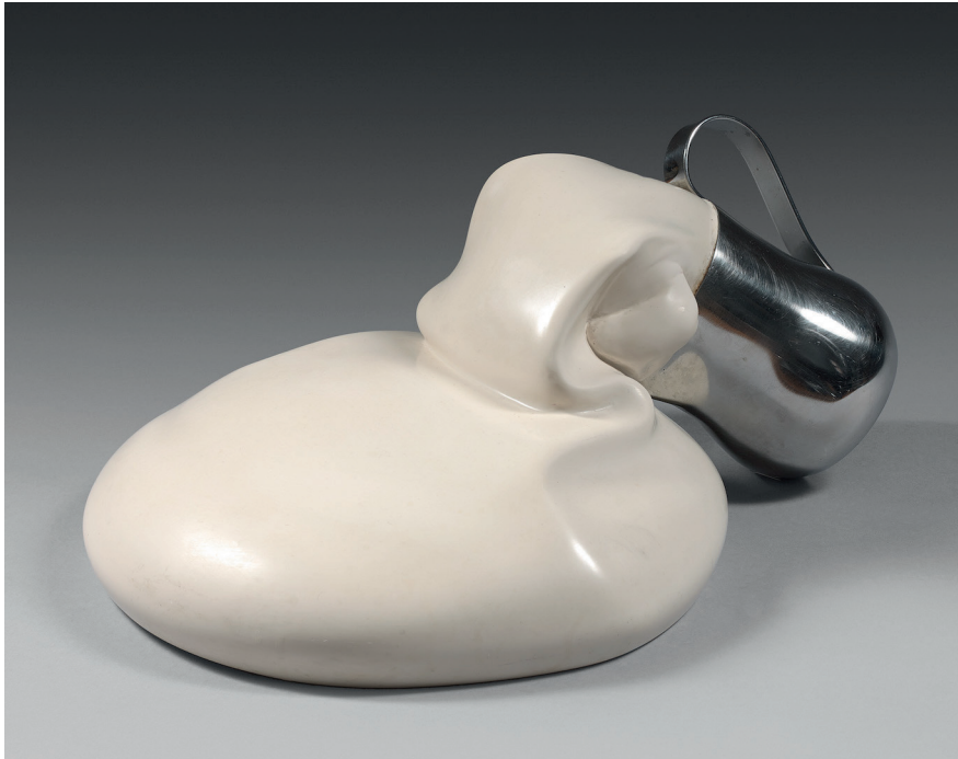
CÉSAR , Expansion , 1989. - résine expansée et laquée, et petit pot de lait en inox, signé et numéroté 109/150.