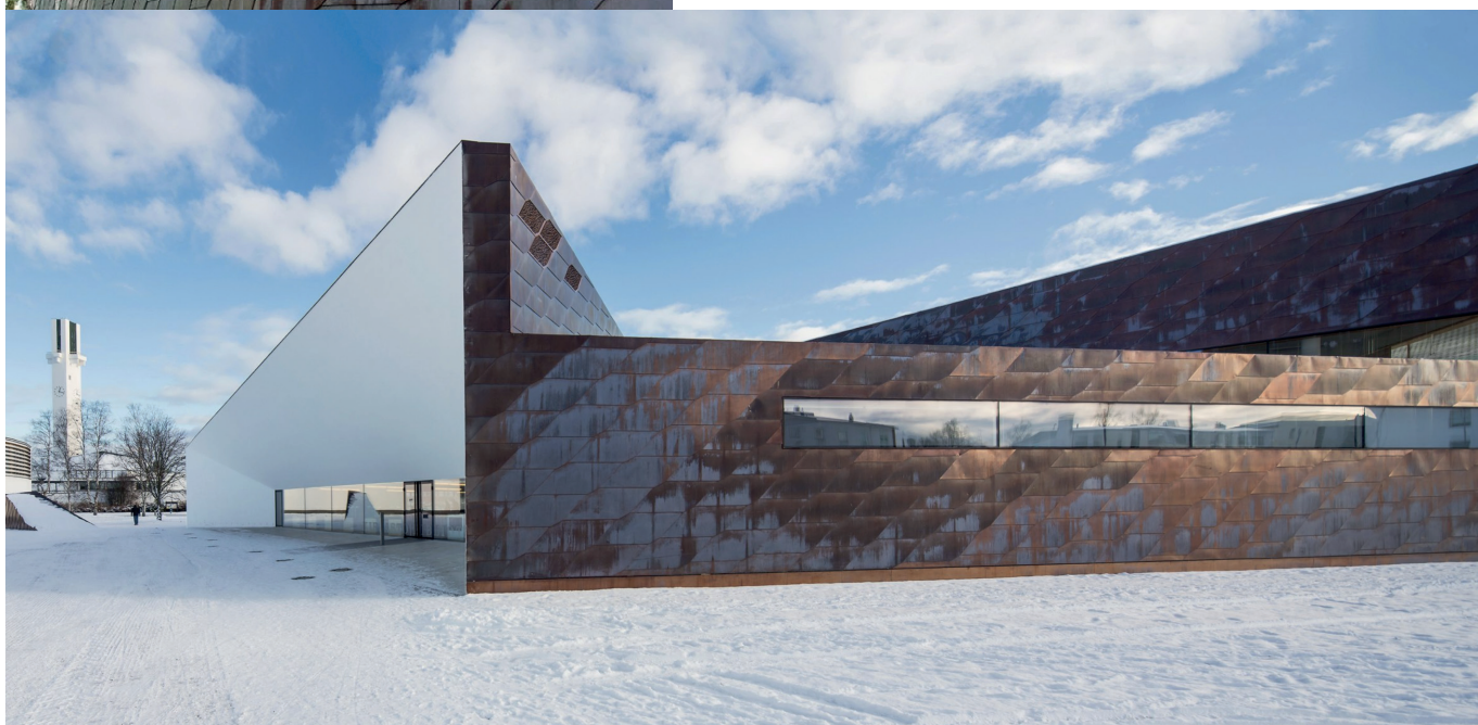
JKMM Architects , nouvelle extension de la bibliothèque de la ville de Seinäjoki (qui fait partie d'un ensemble de bâtiments existants de l'architecte finlandais Alvar Aalto), Finlande, 2012. - Toiture et bardage en cuivre.