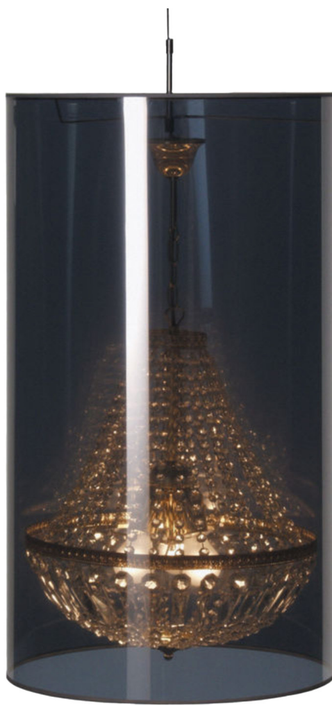
Jurgen BEY (NL), édition MOOOI (Italie), suspension Light Shade Shade, 1999.. - lustre en verre ciselé et cylindre plastique miroir semi-transparent. - modèle diamètre 47cm (hauteur 82cm).