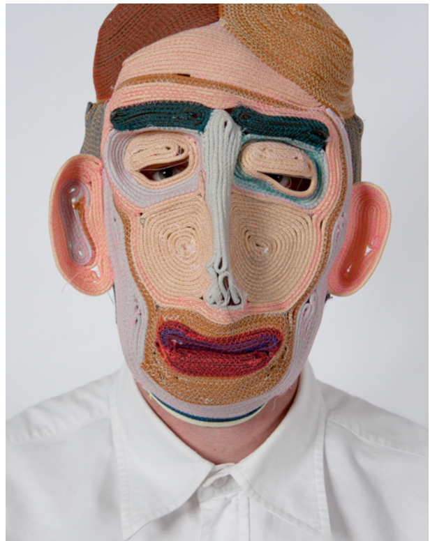
Studio Bertjan Pot, Masks / 2010.

- Série de masques depuis 2010 (en cours), à base de cordages cousus entre eux.